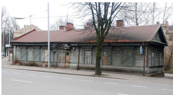
3, 4 pav. Miestiečių namai Naujamiestyje, Donelaičio g. 5 (1896 m.) ir Donelaičio g. 7 (1895 m.)