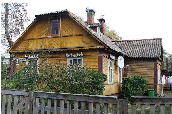
Figs 3, 4. Houses of townsmen in Naujamiestis, Donelaičio g. 5 ir Donelaičio g. 7