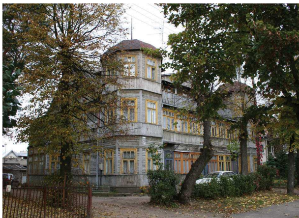
11 pav. Vasarnamis Panemunės kurorte, Gailutės g. 28

dinis kurhauzas sudegė. Vilos statytos vienos šeimos poreikiams, o vasarnamiai būdavo nuomojami poilsiautojams. Jie dviaukščiai, imponuoja stambiais tūriais; būdingas pavyzdys – Gailutės g. 28 (1926 m.) vasarnamis su šešiakampiais rizalitais, kurių kupoliniai stogai primena bokštelius (11 pav.).