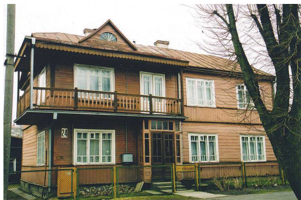
9, 10 pav. Nuomojamų butų namai Žaliakalnyje, Minties rato g. 24 (1928 m.) ir Vilijampolėje, Jurbarko g. 73