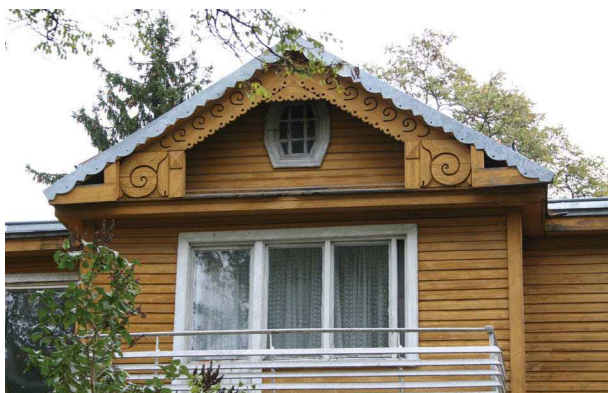
Fig. 11. A summer house in the resort of Panemunė, Gailutės g. 28