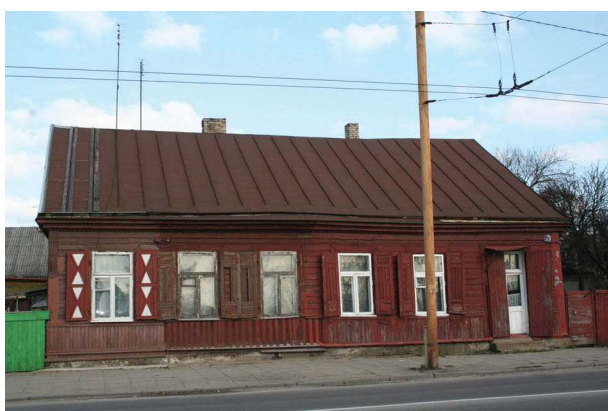
2 pav. XIX a. pabaigos miestiečio namas Vilijampolėje, Jurbarko g. 10 Fig. 2. A house of a townsman in Vilijampolė, Jurbarko g. 10, end of the XIX c.

namus su krautuvėlėmis. Vieni iš jų atgręžti į gatvę šonu, kiti – galu, durys tiesiai iš gatvės, langai su langinėmis. Žemųjų Šančių priemiestis kūrėsi 1862 m. nutiesus geležinkelį – čia steigėsi fabrikai, apsigyveno darbininkai. Nemuno pakrantėje nutiestos gatvelės palaipsniui apstatytos mediniais nameliais nedideliuose sklypuose. Šančiuose labiausiai paplitę vientiso tūrio sodybiniai namukai (5–6 pav.), kai kurie su atvirais prieangiais arba verandomis, su langinėmis. Tarpukariu daug sodybinių namų pastatyta Žaliakalnyje. Jie stačiakampio plano, vieno arba dviejų butų, kai kurie paauskštinti mezoniniais, mansardomis, kiti turi įstiklintas verandas. Atviri prieangiai būna su profiliuotomis medžio kolonėlėmis. Pasitaiko verandų, kurių langai suskaidyti geometrinio piešinio rėmais, švyti spalvotais stiklais. Išraiškingumo suteikia langinės, sandriškai, apylangės, frontonėliai, piliastų imitacijos, kiaurapjūvių lentelių dekoras. Nors namų tūriai giminingi lietuvių etninei tradicijai, tačiau dekoras kartais artimas klasicizmo, baroko, Art Nouveau stilistikai.