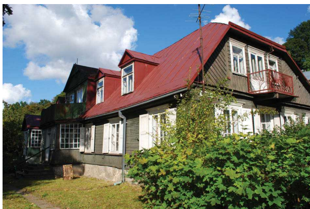
1 pav. XIX a. vidurio dvarelis Būgos g. 4 Fig. 1. The wooden manor in Būgos g. 4