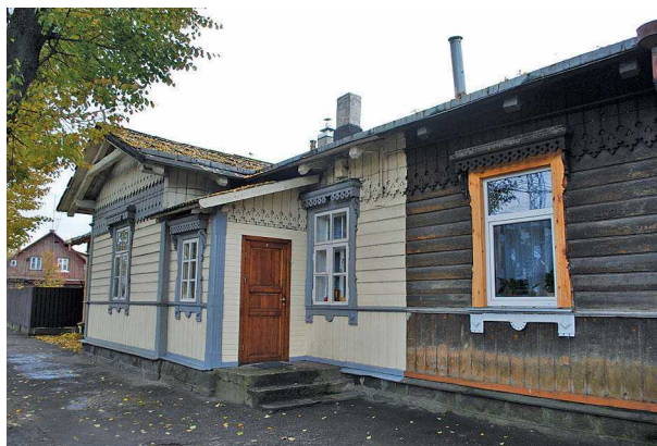
8 pav. Geležinkelio tarnautojų namas Šančiuose, Juozapavičiaus pr. 125