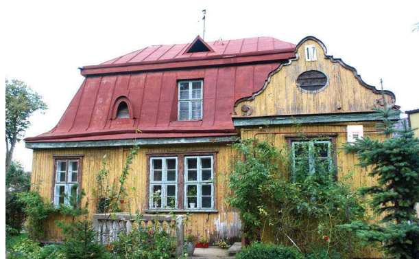
12, 13 pav. Baroko interpretacijos tarpukario vilose: Panemunėje, Gailutės g. 19; Žaliakalnyje, Minties rato g. 2/17