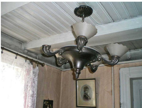
17, 18 pav. Išlikusios autentiškos interjero detalės Figs 17, 18. The survived authentic interior details