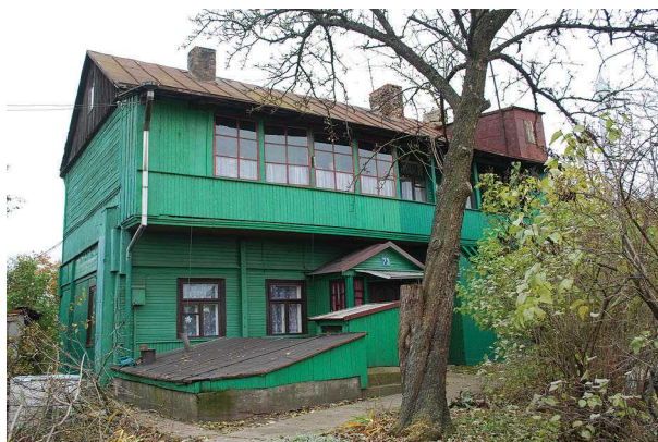
Fig. 9, 10. Rental houses in Žaliakalnis, Minties rato g. 24 and Vilijampolė, Jurbarko g. 73