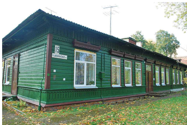
7 pav. Puskarininkių namas Šančiuose, Juozapavičiaus pr. 15 Fig. 7. Warrant-officer house in Šančiai, Juozapavičiaus pr. 15

Tarpukariu suklestėjo Panemunės kurortas, čia pastatyta išraiškingų medinių vilų, jos beveik visos išlikusios. Tik architekto S. Kudoko projektuotas me-