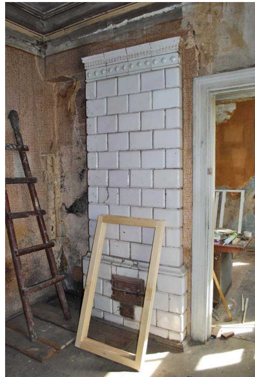
19 pav. XIX a. pabaigos name, neįrašytame į Kultūros vertybių registrą, savininkai savo iniciatyva restauruoja interjero elementus

Fig. 19. The owners of a house that is not included on the Register of Cultural Property carefully restore interior elements on their own initiative